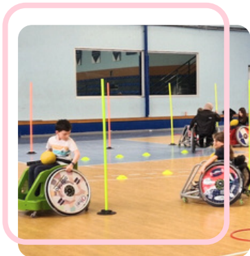
Séance d'handi rugby avec la classe de CP / Grande section du groupe scolaire Chevreur Lestonnac à Lyon 7.