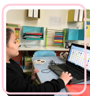
Utilisation du numérique dans le programme pédagogique de certains élèves.