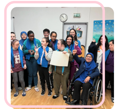
Tous en bleu à l'occasion de la journée internationale de sensibilisation à l'autisme.