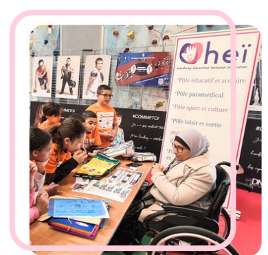
Atelier de sensibilisation à l'autisme lors de la dixième édition des rencontres XIII Handi organisée par le Comité Rhône et Métropole de Lyon rugby à XIII.